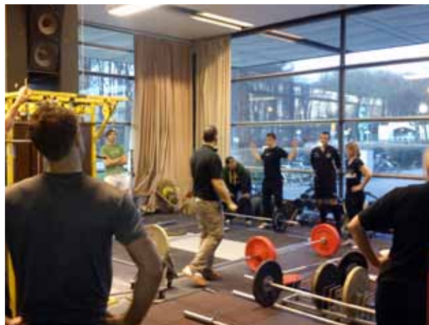
Full aktivitet när steg-1-kursen genomfördes i Landskrona.