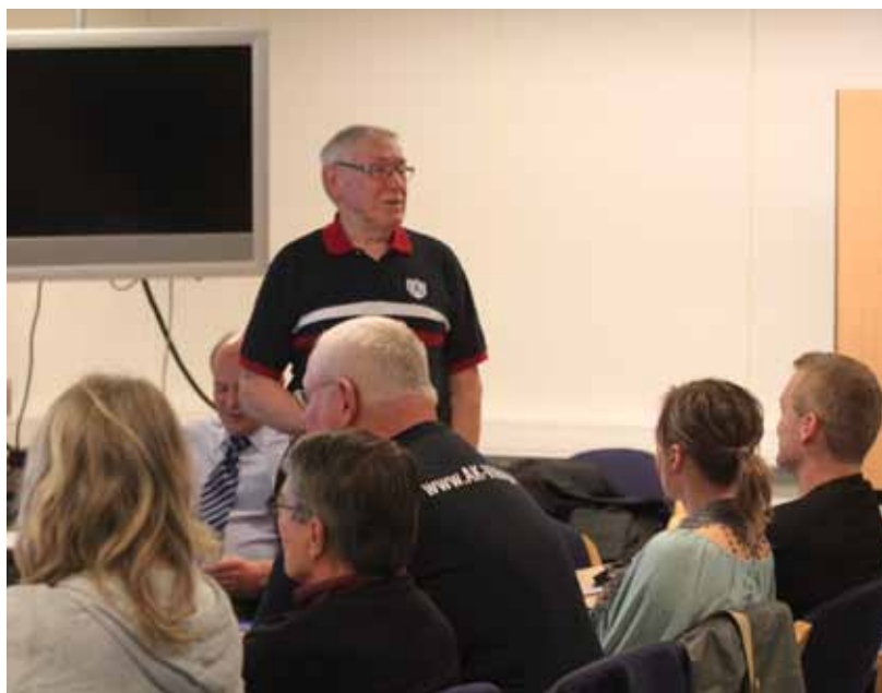
Den internationella domarkadern får lära sig de senaste nyheterna rörande tävlingsreglerna.