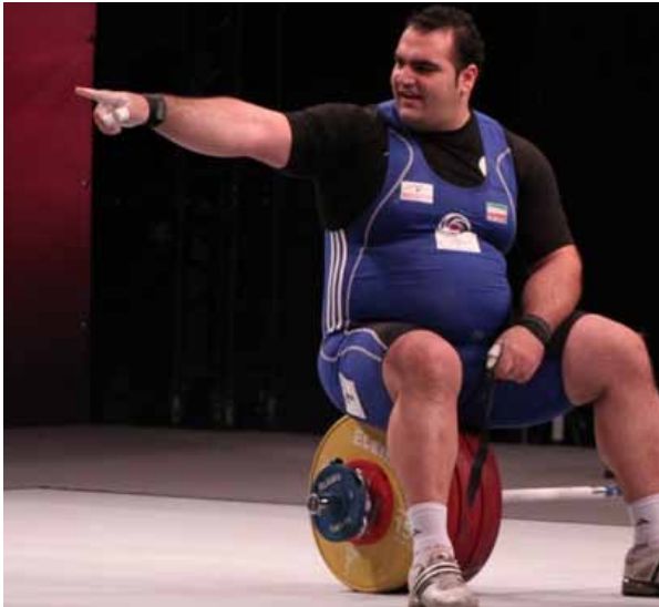
Salimikordiasabi pekar ut riktningen till London!