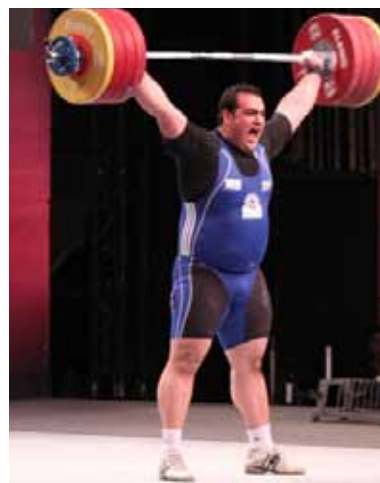
Slutställning vid rekordlyftet.