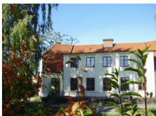
STF Landskrona Vandrarhem

Väljer ni att bo på något av hotellen bor ni centralt och det tar ca 7 minuter med bil till tävlingshallen.